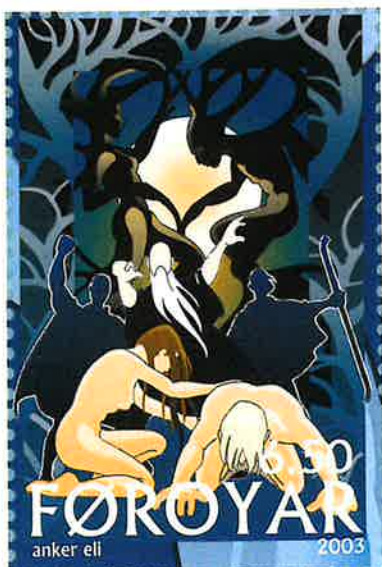
Nornurnar og træið, 2003, eftir Anker Eli Petersen, f. 1959