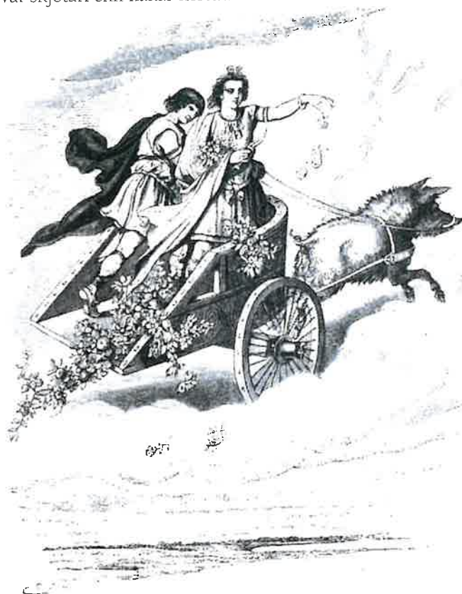
Froyur og Skímir breiða út fruktbari, 1882, eftir Carl Emil Doepler (1824-1905)

Froyur var fruktbarisgudurin og gudur høvdinganna. Froyur átti skip, har pláss var fyri øllum ásunum. Skipið hevði altíð góðan byr og kundi sigla bæði á landi og sjógvi. Skipið kundi leggjast saman sum eitt turriklæði, tá ið tað ikki varð brúkt. Froyur hevði ein gølt, sum lýsti í myrkri og var skjótari enn nakar hestur.