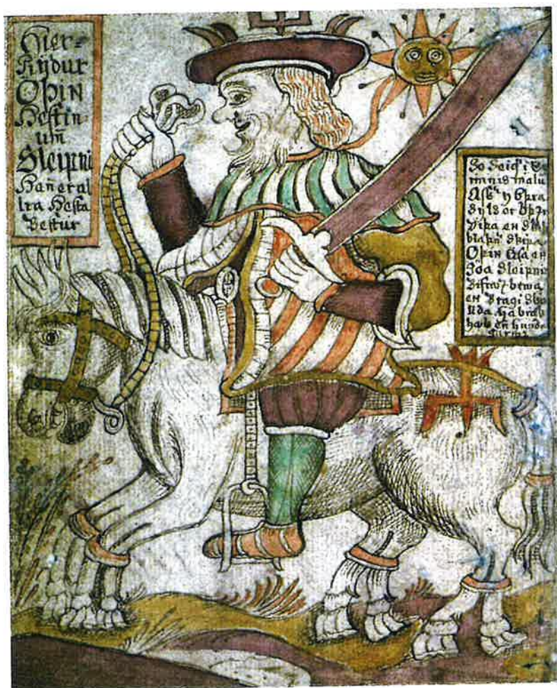
Óðin og Sleipnir.