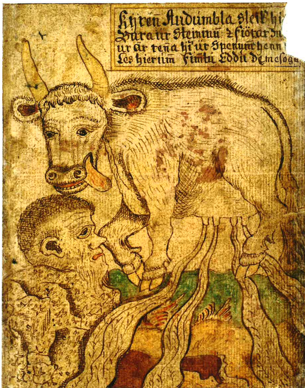
Kúgvín Eyðhumla sleikir Búra úr steinum og fjóra mjólkaár flóta úr júgrunum.