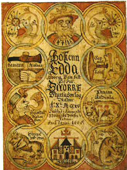
Perma frá 18. öld til Snorra Eddu.

Tað er ilt at siga við vissu, hvussu gamla guda trúgvin hevur verið her á landi, tí vit hava ongar skrivligar keldur hesum viðvíkjandi. Vit vita tó, at íslendingar hava í varðveitslu frásagnir um hin forna átrúnaðin. Hesar frásagnir vórðu í 1100-talinum skrivaðar á skinn, ið vórðu evnað til hetta endamál. Mesta kunnleika um gomlu gudalæruna fáa vit úr gudakvæðunum Völuspá og Hávamál, ið finnast í tekstum, nevndir Eldra Eddan. Völuspá er um framtíð jarðarinnar. Hávamál er um átrúnaðin í Norðurlondum í fornöld.