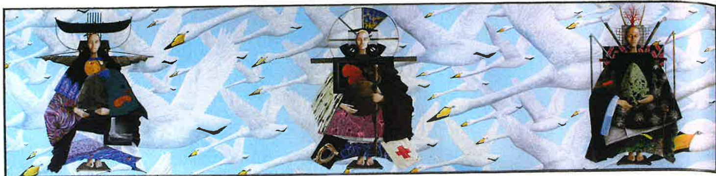
Nornurnar, 2006, eftir Edward Fuglø, f. 1965