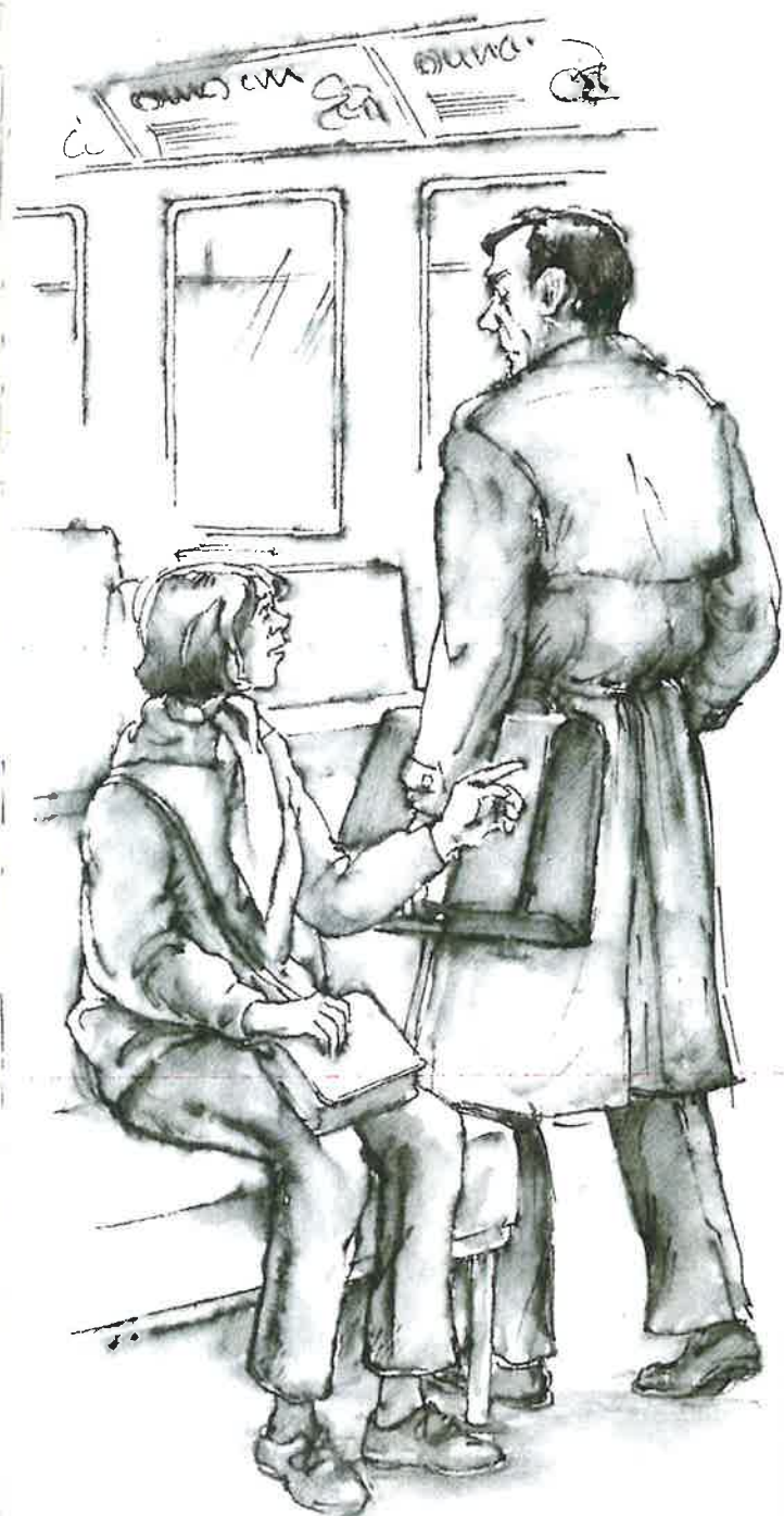
Mette von der Mause

men noget aldeles uacceptabelt, nederdrægtigt sludder.