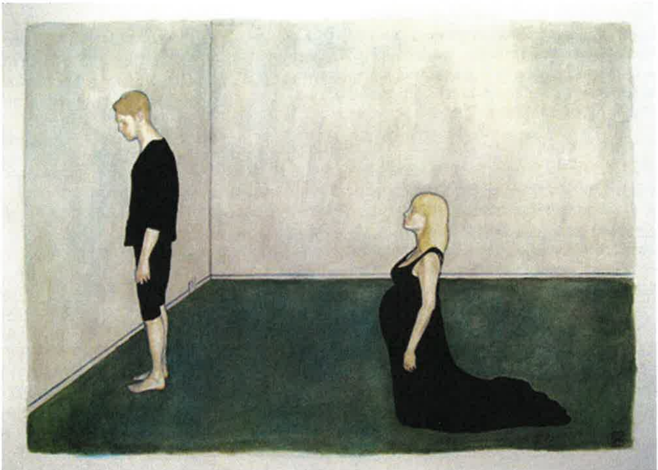
Heiðrik á Heygum: "Barnið," 2012 – vatnlitir á pappír.