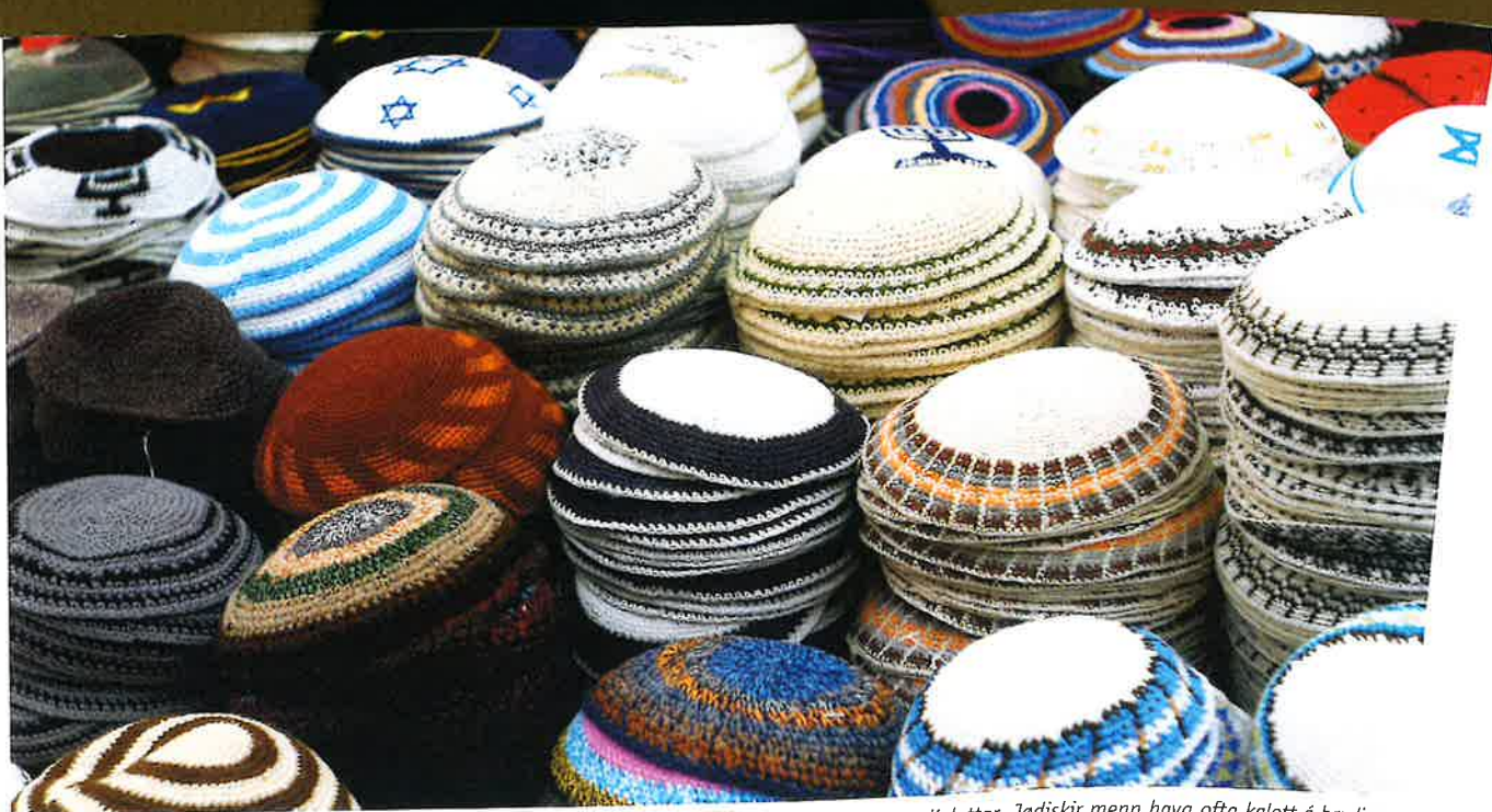
Kalottar. Jødiskir menn hava ofta kalott á høvðinum.

Í nøkrum sýnagogum verður hildið fast við, at tað bert eru dreingirnir, ið sleppa at lesa í Toraini. Genturnar kunnu savnast í smærri bólkum og kanska lesa yrkingar ella syngja sálmar, men sum so verður einki serstakt gjørt í sambandi við gudstænastuna fyri teimum. Foreldrini kunnu tó halda veitslu fyri gentunum.