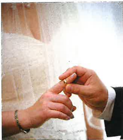
Brúðgómurinn setur ring á fremstafingur á brúðrinni.

Brúðgómurinn rættir brúðrinni eina skrivliga avtalun, ketuba, har hann lovar, at hann altíð vil syrgja fyri henni, vil vera trúgvur og æra og elska hana. Brúðurin hevur slør fyri andlitið, men tá avtalan er undirskrivað, verður slørið lyft.