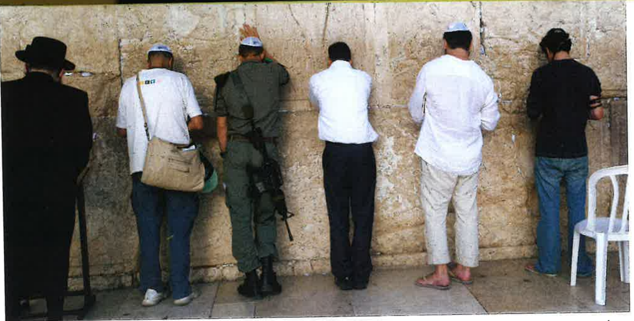
Jøðar biðja við Grátimúrinn í Jerúsalem í Ísrael.