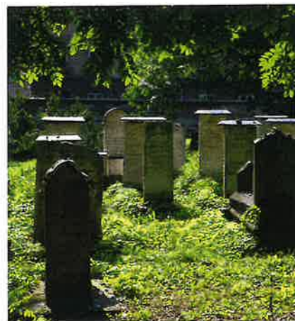
Jødiskur kirkjugarður í Krakov í Póllandi.