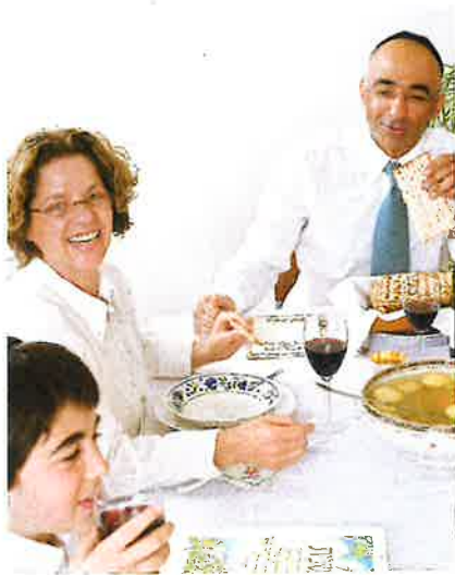
Seder, máltíð, sum verður hildin fyrsta kvöldið í sambandi við jødisku páskirnar.