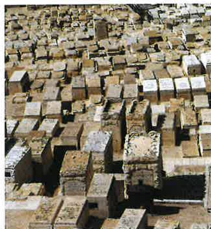
Jødiskur kirkjugarður í Jerúsalem í Ísrael.

Soleiðis varð jødadómurin kendur í mongum londum og kom at slóða vegin fyri kristindóminum, serliga í londunum um Miðjarðarhavið.