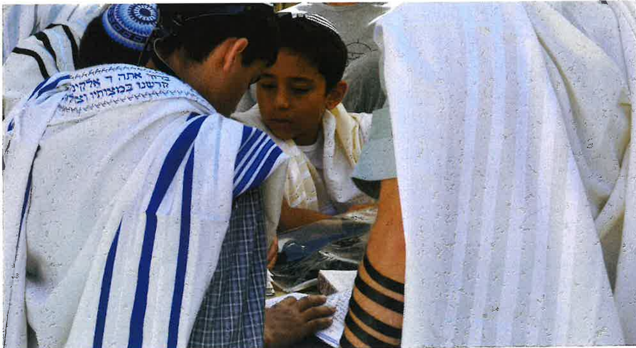
Ungur drongur lesur úr Toraini í sambandi við Bar Mitzva.