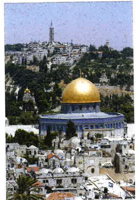
Klettamoskan í Jerúsalem. Moskan stendur har templið hjá jødum einaferð stóð.

Jerúsalem hevur eisini stóran týðning hjá kristnum, av tí at stórir partur av Jesu lívi er knýttur at Jerúsalem.