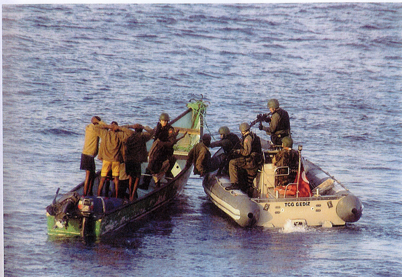
Tropper anholder pirater i farvandet ud for Somalia (politiken.dk)

*Øjenvidneskildring: En persons egne iagttagelser, beskrivelser og meninger.