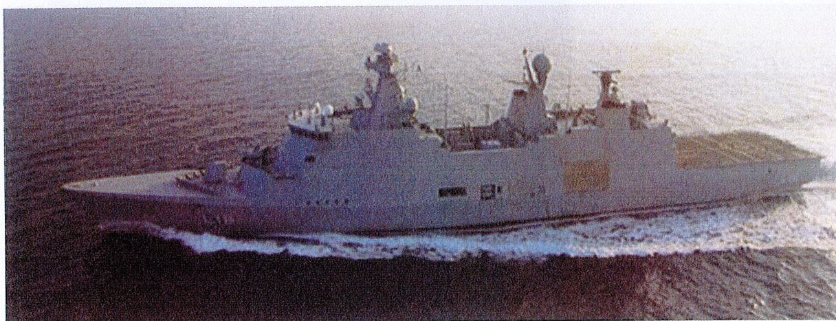
14 iranske og pakistanske gidsler er blevet frigivet takket være det danske krigsskib Absalon, der er på piratjagt ved Somalias kyst. (dr.dk)