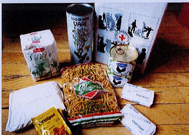
Læknað utan landamörk