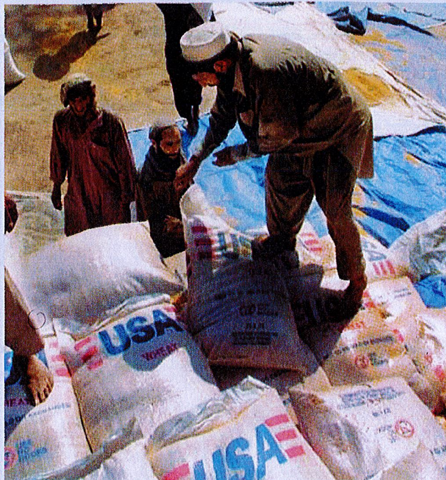
Læknað utan landamörk, Pol Foto