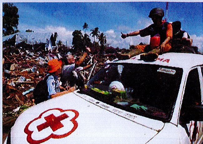
Eftir flóðaldu, Reyði Krossur