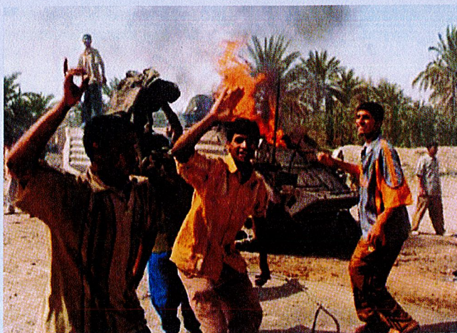
Hermenn í Irak