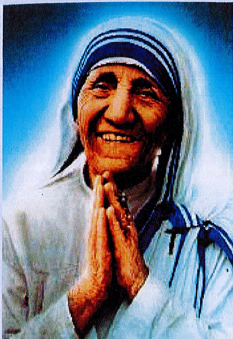
Móðir Teresa